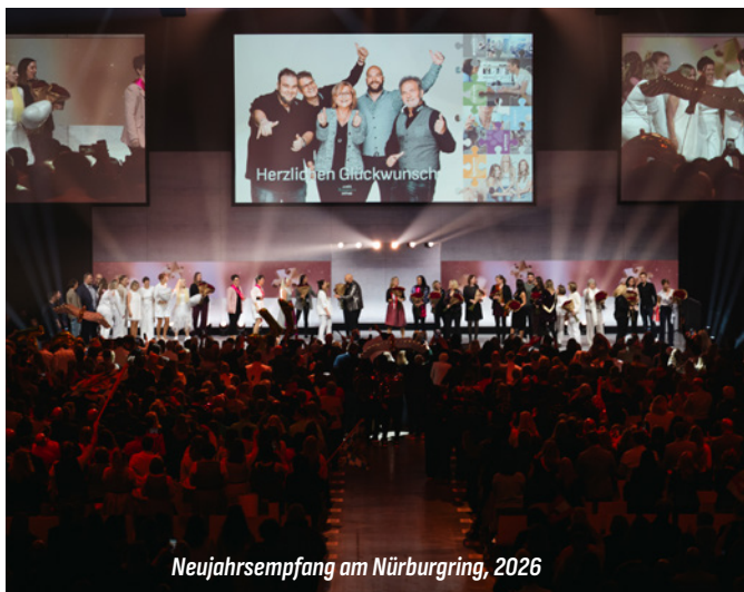
Neujahrsempfang am Nürburgring, 2026