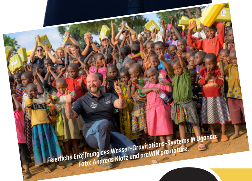
Feierliche Eröffnung des Wasser-Gravitations-Systems in Uganda.

Du möchtest mit einem stabilen, erfolgreichen Unternehmen als Partner zusammenarbeiten, das neben Wachstum auch auf Nachhaltigkeit ausgerichtet ist. Wir bieten Vertriebsexpert*innen oder Neueinsteiger*innen die perfekte Erfolgsplattform. Du wirst selbstständige(r) Unternehmer*in, aber bei uns bist du nie alleine!