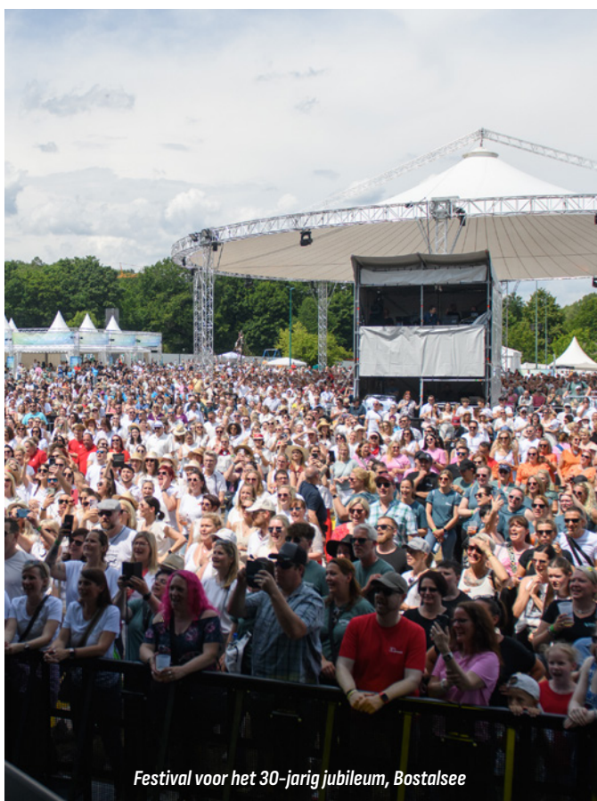
Festival voor het 30-jarig jubileum, Bostalsee