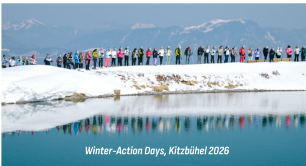
Winter-Action Days, Kitzbühel 2026

Tijdens de Action Days krijg je de kans om de teamspirit bij proWIN vanaf het allereerste uur te beleven en direct beloond te worden. Werk samen in een 4-koppig team, dat ook uit ervaren teamleden kan bestaan, en werk samen naar het omzetdoel toe. Jij en je team worden beloond met een reis naar Oostenrijk die vol zit met unieke momenten die je nooit meer zult vergeten.