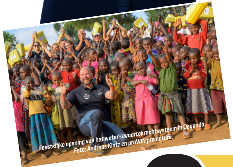
Feestelijke opening van het water-zwaartekrachtstelsel in Oeganda.

Je wilt samenwerken met een stabiel, succesvol bedrijf als partner, een bedrijf dat behalve op groei, ook op duurzaamheid is gericht. We bieden verkoopexperts of nieuwe starters het perfecte succesplatform. Je wordt zelfstandig ondernemer, maar bij ons ben je nooit alleen!