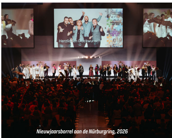
Nieuwjaarsborrel aan de Nürburgring, 2026