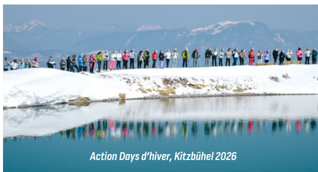
Action Days d'hiver, Kitzbühel 2026

Avec les Action Days, vous avez la possibilité, de découvrir l'esprit d'équipe chez proWIN dès la première heure et d'être immédiatement récompensé. Vous formez une équipe de 4, qui peut aussi inclure des membres d'équipe expérimentés, et vous travaillez ensemble pour atteindre un objectif de chiffre d'affaires. Vous et votre équipe serez récompensés par un voyage en Autriche rempli de moments uniques, que vous n'oublierez jamais.