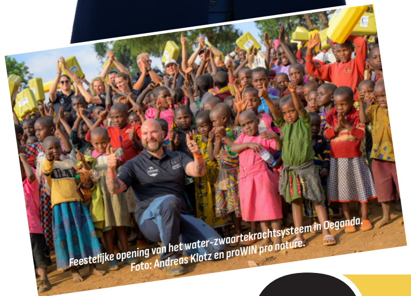
Feestelijke opening van het water-zwaartekrachtstelsel in Oeganda.

Je wilt samenwerken met een stabiel, succesvol bedrijf als partner, een bedrijf dat behalve op groei, ook op duurzaamheid is gericht. We bieden verkoopexperts of nieuwe starters het perfecte succesplatform. Je wordt zelfstandig ondernemer, maar bij ons ben je nooit alleen!