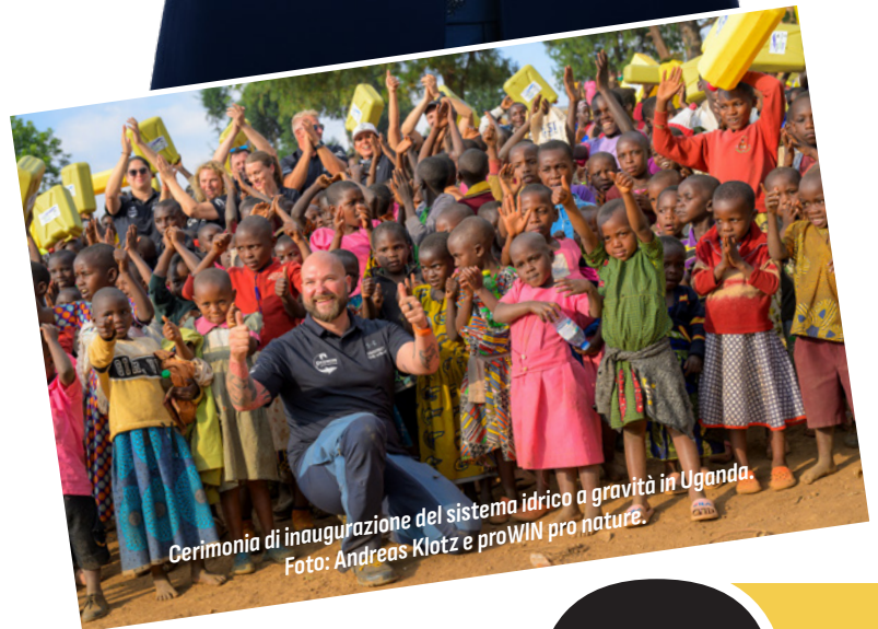
Cerimonia di inaugurazione del sistema idrico a gravità in Uganda.

Desideri collaborare con un'azienda solida e di successo, focalizzata sia sulla sostenibilità che sulla crescita. Offriamo a esperti di vendite o a chi è alle prime armi la piattaforma ideale per raggiungere il successo. Diventerai un imprenditore autonomo, ma con noi non sarai mai solo!