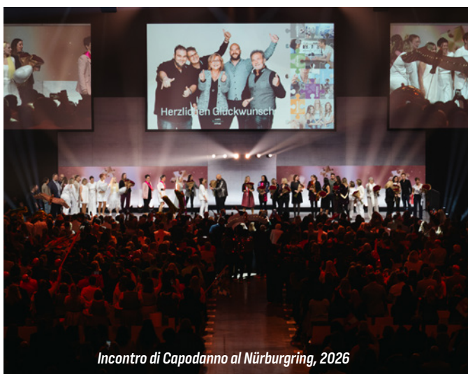
Incontro di Capodanno al Nürburgring, 2026