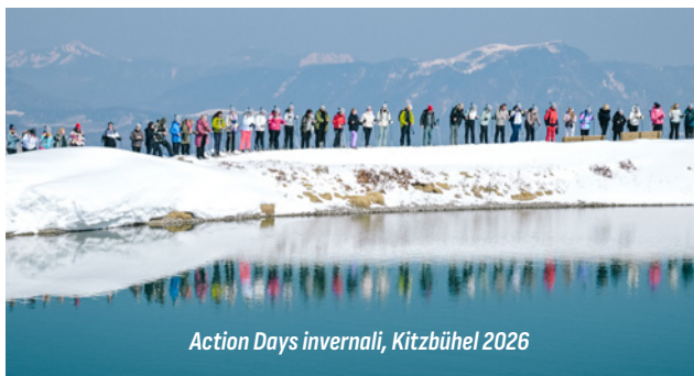
Action Days invernali, Kitzbühel 2026

Con gli Action Days, avrai l'opportunità di sperimentare lo spirito di squadra di proWIN fin dal primo giorno e di essere ricompensato immediatamente. Formerete un team di quattro persone, che potrà includere anche membri esperti del team, e lavorerete insieme per raggiungere un obiettivo di vendita. Tu e il tuo team sarete ricompensati con un viaggio in Austria ricco di momenti unici che non dimenticherete mai.