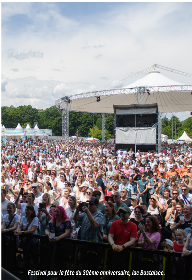
Festival pour la fête du 30ème anniversaire, lac Bostalsee.