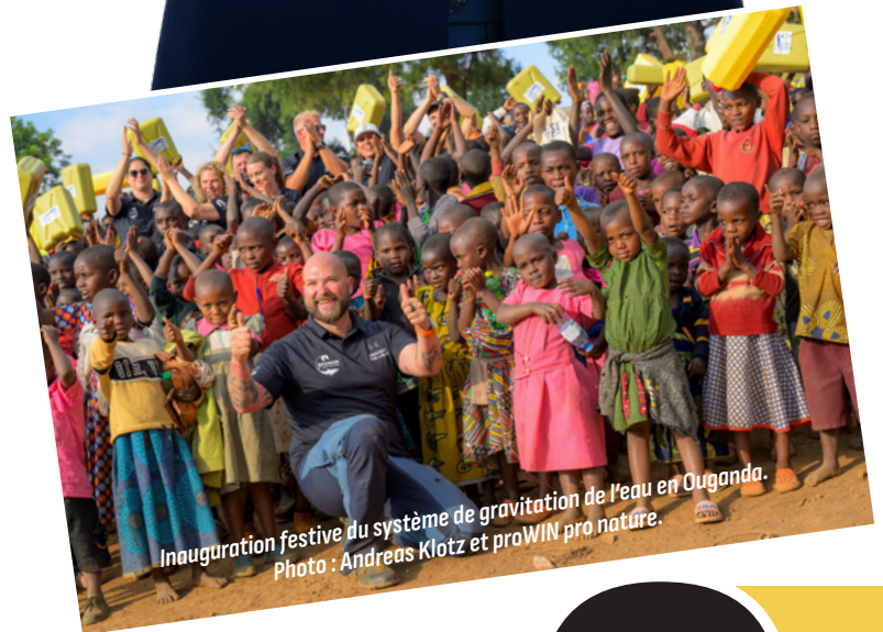
Inauguration festive du système de gravitation de l'eau en Ouganda.