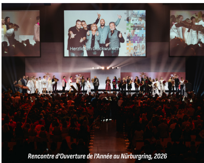
Rencontre d'Ouverture de l'Année au Nürburgring, 2026