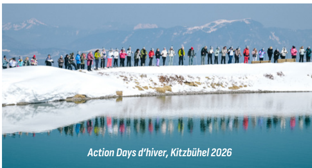
Action Days d'hiver, Kitzbühel 2026

Avec les Action Days, vous avez la possibilité, de découvrir l'esprit d'équipe chez proWIN dès la première heure et d'être immédiatement récompensé. Vous formez une équipe de 4, qui peut aussi inclure des membres d'équipe expérimentés, et vous travaillez ensemble pour atteindre un objectif de chiffre d'affaires. Vous et votre équipe serez récompensés par un voyage en Autriche rempli de moments uniques, que vous n'oublierez jamais.